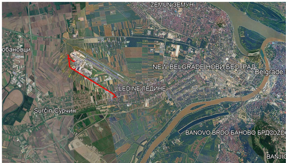
Слика 2.1 Приказ макролокације предметног пројекта

Између коловозних трака и околних парцела налазе се површине од укупно 23.593,44 m 2 које се воде као неуређено зеленило. Тренутно су под самониклом вегетацијом и травнатим покривачем, без пејзажног обликовања и техничког система наводњавања. Ове површине служе као физички размак (тампон зона) између саобраћајница и околних објеката (хотел „Air Serbia”, пословне зграде аеродрома).