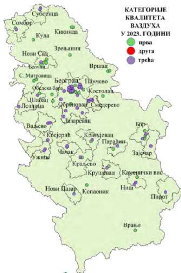
Слика 5.1 Категорије квалитета ваздуха у 2023.- оцена у складу са Законом о заштити ваздуха

Према званичним налазима извештаја СЕПА за 2023. годину, у агломерацији Београд, којој административно припада и општина Сурчин, ваздух је задржао статус III категорије (прекомерно загађен ваздух). Главни узрочник овакве оцене је прекорачење граничних вредности суспендованих честица PM_{10} и PM_{2.5} . Док је на нивоу целе Републике Србије забележен благи пад броја мерних места са прекорачењем годишњих граничних вредности за PM_{10} , на територији Београда су дневне граничне вредности ( 50 \mu g/m^3 ) и даље прекорачене током значајног броја дана у години. Посебно је истакнуто прекорачење граничних вредности азот-диоксида ( NO_2 ) на локацијама са интензивним саобраћајем, што је релевантно за предметни пројекат због велике густине протока возила на прилазима аеродрому. Београд је идентификован као локација где је годишња гранична вредност за азот-диоксид ( NO_2 ) од 40 \mu g/m^3 прекорачена на мерним местима са високим интензитетом саобраћаја. За специфичну микролокацију пројекта, раскрснице Нова 5 и Нова 8 карактеристично је присуство аерозагађења које потиче од емисије авионских мотора (керозин) и тешког теретног саобраћаја, што квалитет ваздуха дефинише као амбијентално оптерећен.