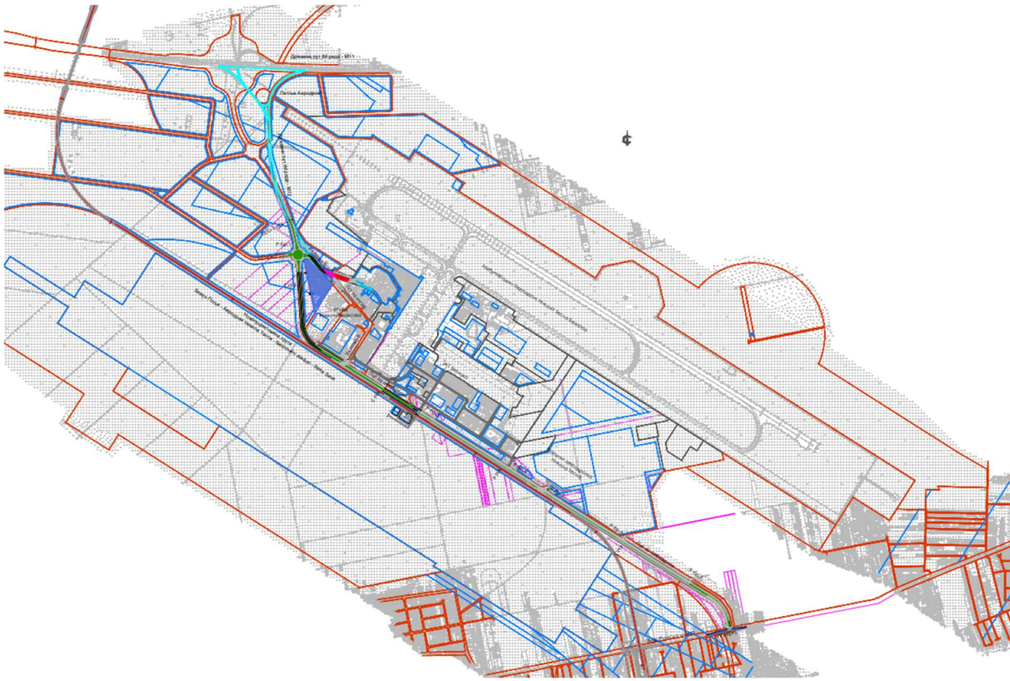
Слика 2.2 Приказ микролокације предметног пројекта

обезбеђује доступност стручног кадра, студената и истраживача, чиме се осигурава дугорочна одрживост пројекта.