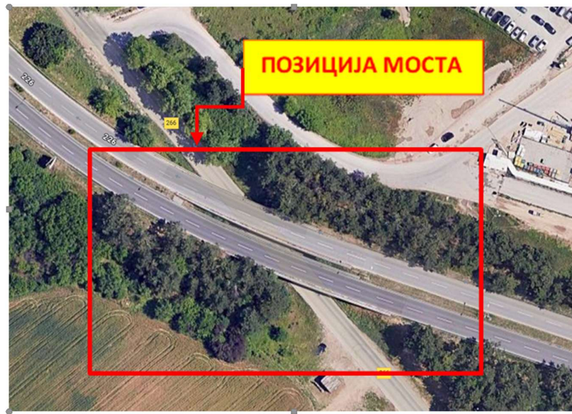
Слика 3.1 Позиција моста који се руши